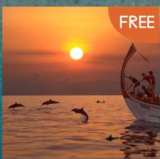
SPA 30 Mins