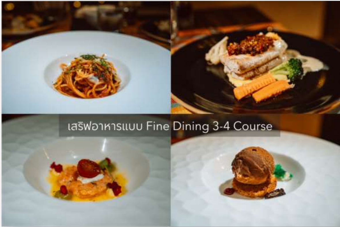
เสิร์ฟอาหารแบบ Fine Dining 3-4 Course