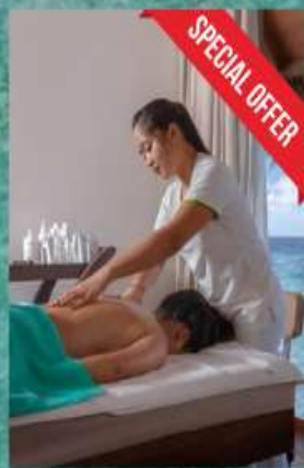
SPA 30 mins