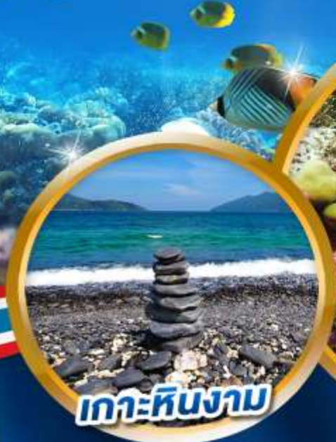
เกาะหินงาม