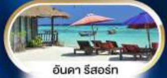
อินคา รีสอร์ท