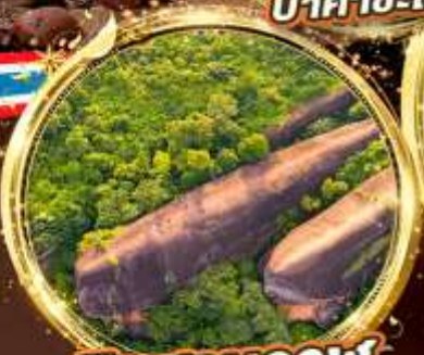
หินสามวาฬ