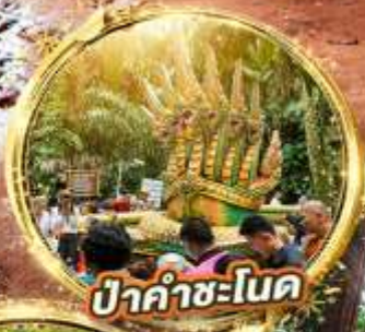
ป่าคำชะโนด