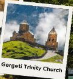
Gergeti Trinity Church