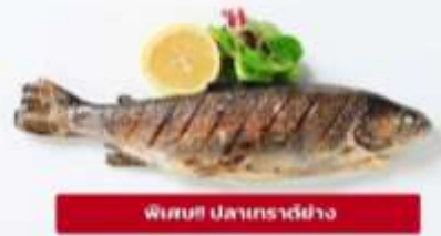
พิเศษ! ปลาเทราต์ย่าง

เที่ยง ๑๐ รับประทานอาหารเที่ยง (มื้อที่3) เมนูพิเศษ ปลาเทราต์ย่างท่านละ 1 ตัว นำท่านเดินทางสู่ เมืองอินส์บรุค (Innsbruck) (ระยะทาง 226 ก.ม. / 3.30 ชม.) ตั้งอยู่บนที่ราบลุ่มแม่น้ำอินน์ กลางหุบเขาของเทือกเขาแอลป์ ซึ่งสามารถ มองเห็นยอดเขาสูง