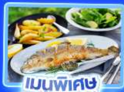
เมนูพิเศษ ปลาเกรดอย่าง

อัลสส์ตีทท์ เวียนนา อินส์บรุค ปราสาทนอยชวาสไตน์ ลูเซิร์น ริก