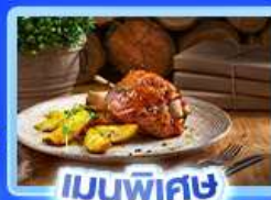
เมนูพิเศษ ขาหมูเยอรมัน

อาหาร 12 มื้อ + บนเครื่อง พักโรงแรมดี 3-4 ดาว