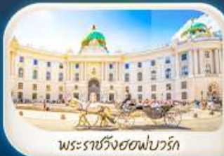
พระราชวังฮอฟบวร์ก

12-18 มี.ค.68 / 19-25 มี.ค.68 28 เม.ย. - 4 พ.ค.68 7-13 พ.ค.68