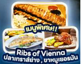
เมนูพิเศษ!! Ribs of Vienna ปลาเทราสย่าง, บาหมูเยอรมัน