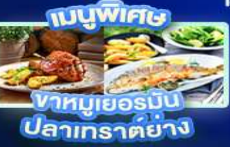
เมนูพิเศษ ขาหมูเยอรมัน ปลาเกราด์ย่าง

เวียนนา ปราสาทนอยชวาสไตน์ ลูเซิร์น เซอร์แมท ชุก ซูริก