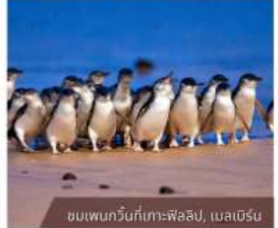
ชมเพนกวินที่เกาะฟิลลิป, เมลเบิร์น