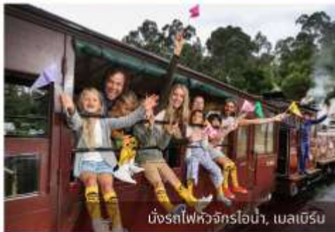
นั่งรถไฟหัวจักรไอน้ำ, เมลเบิร์น