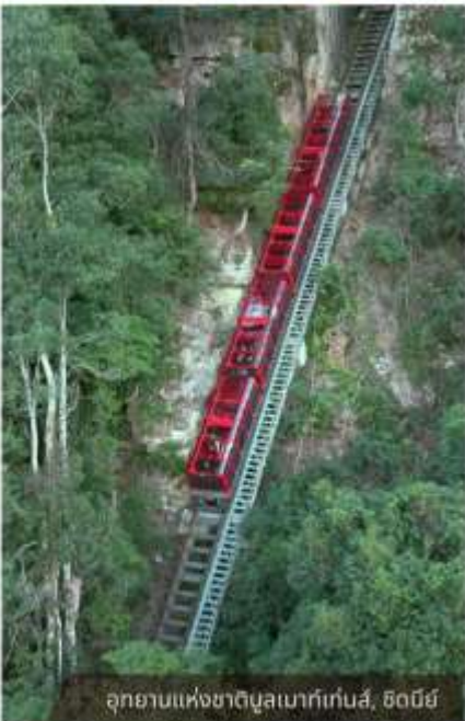
อุทยานแห่งชาติบลูเมาท์เท็นส์, ซิดนีย์