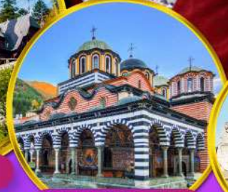
อารามมรดกโลกริลา