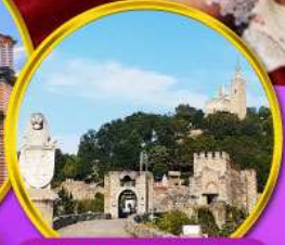
ป้อมชาเรเวทส์