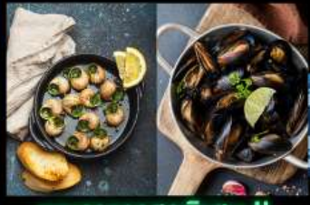
เมนูอาหารสุดพิเศษ !! หอยแมลงภู่อบไวน์ขาว และหอยเอสคาโก้