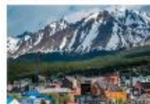
เมืองเอลคาลาฟาเต

** พักที่ Xelena Hotel 4* หรือเทียบเท่า **