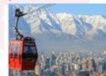
นั่งกระเช้าขึ้นสู่เนินเขาซานต้า ลูเซีย