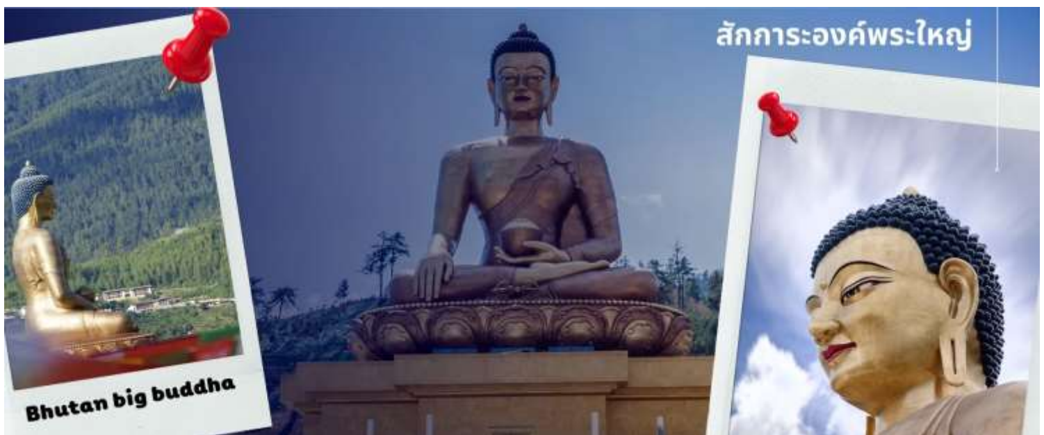
และสร้างพระพุทธรูป ให้แก่รัฐบาลประเทศภูฏานให้ท่านไหว้ขอพรเพื่อเป็นสิริมงคล

นำท่าน สักการะองค์พระใหญ่ ที่ตั้งอยู่สูงที่สุดในโลก และได้รับความร่วมมือจากเศรษฐีชาวสิงคโปร์ บริจาคเงินซื้อที่ดิน