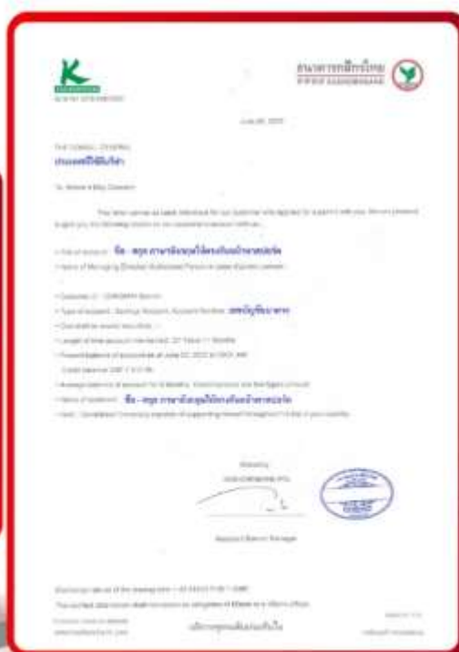
ตัวอย่าง Bank Guarantee ที่ผู้สมัครต้องขอจากธนาคาร