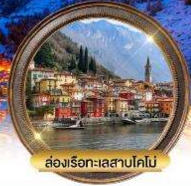
ล่องเรือทะเลสาบโคโม