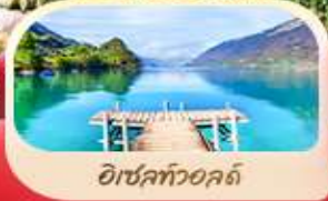
อีเซลท์วอลด์