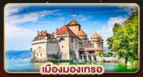
เมืองมงเทร