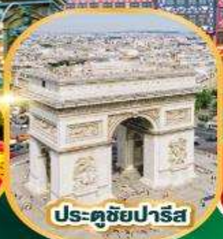
ประตูดชัยปารีส