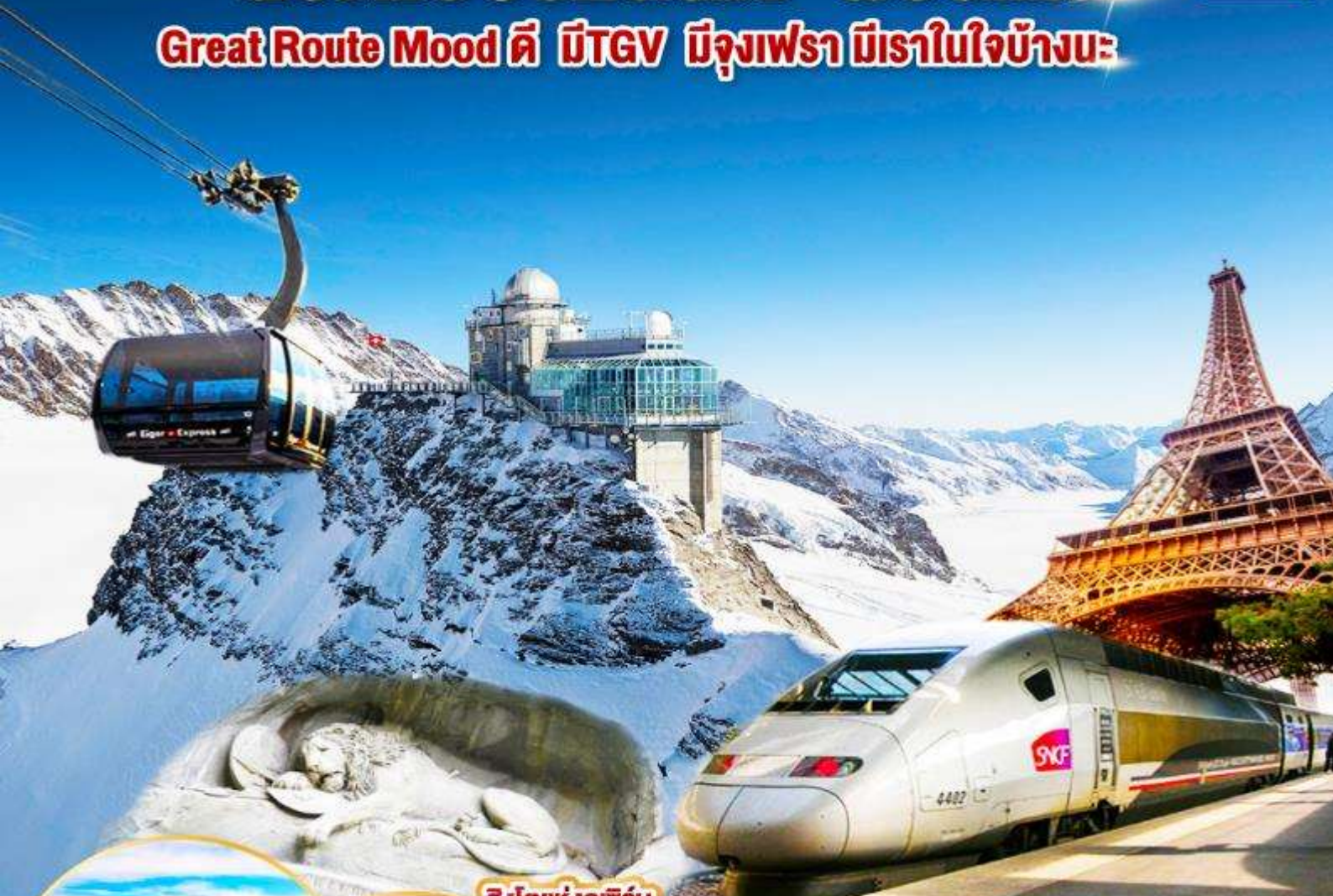
สิงโตแห่งลูซิิร์น

Great Route Mood ดี มีTGV มีจุงเฟรา มีเราในใจบ้างนะ