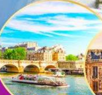
ล่องเรือแม่น้ำแซนน์