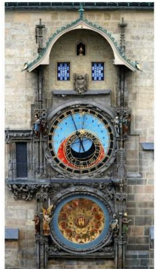
นวมฟาใช้ทคล็อคเค่นทรัม

นำท่านชม บ่อหมีสีน้ำตาล สัตว์ที่เป็นสัญลักษณ์ของกรุงเบิร์น นำท่านชม มาร์กาสเซ ย่านเมืองเก่า ปัจจุบันเต็มไปด้วยร้านดอกไม้และบูติก เป็นย่านที่ปลอดภัย จึงเหมาะกับการเดินเที่ยวชมอาคารเก่า อายุ 200-300 ปี นำท่านลัดเลาะชม ถนนจุงเคอร์นกาสเซ ถนนที่มีระดับสูงสุดของเมืองนี้ ซึ่งเต็มไปด้วยร้านภาพวาดและร้านขายของเก่าในอาคารโบราณ ชม นวมฟาใช้ทคล็อคเค่นทรัม อายุ 800 ปี ที่มีโซวให้ดูทุกๆชั่วโมงในการตีบอกเวลาแต่ละครั้ง นวมฟานี้ ในช่วงปี ค.ศ. 1191-1256 ใช้เป็นประตูเมืองแห่งแรก ภายหลังได้ดัดแปลงใช้ทคล็อคเค่นทรัมให้กลายมาเป็นหอนวมฟาพร้อมติดตั้งนวมฟาดาราศาสตร์เข้าไป