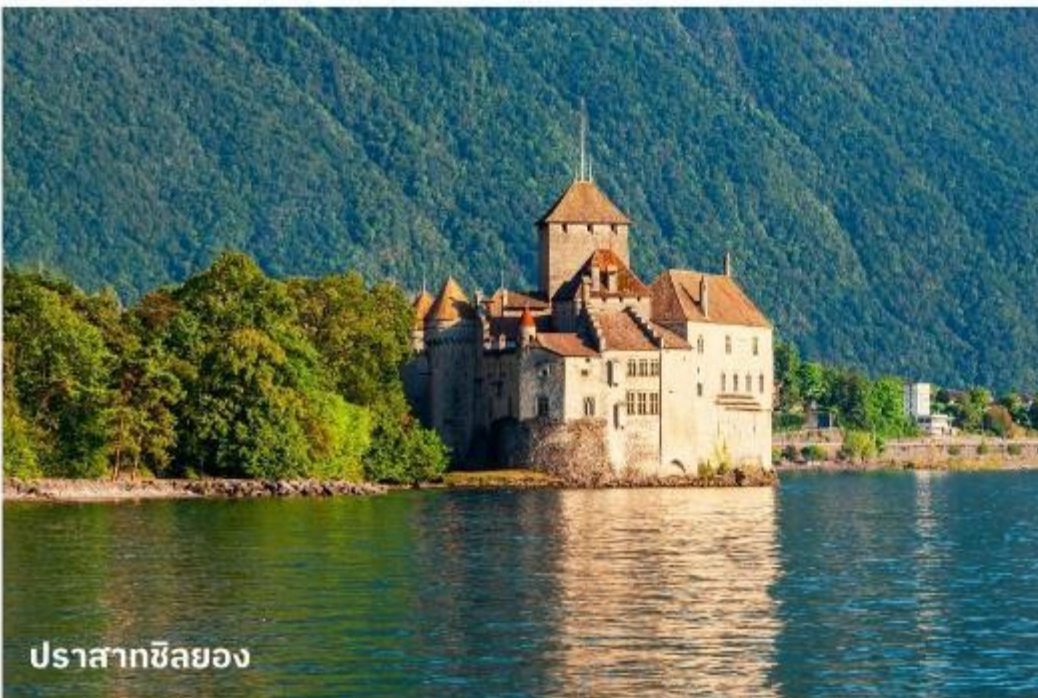
ปราสาทซิลยอง