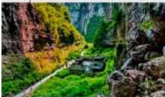
อุทยานแห่งชาติหลุมฟ้า 3 สะพานสวรรค์