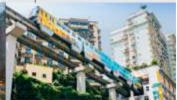
รถไฟฟ้าทะเลตึก

*ทางบริษัทฯ ขอสงวนสิทธิ์ในการสลับโปรแกรมทัวร์ตามความเหมาะสมขึ้นอยู่กับสถานการณ์ปัจจุบัน โดยคำนึงถึงผลประโยชน์ของลูกค้าเป็นสำคัญ