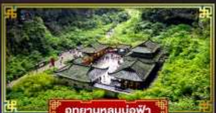
อุทยานหลุมฟ้า

"ฉงชิ่ง" มหานครสุดอลัง เมืองมรดกโลก อุทยานแห่งชาติหลุมฟ้า 3 สะพานสวรรค์