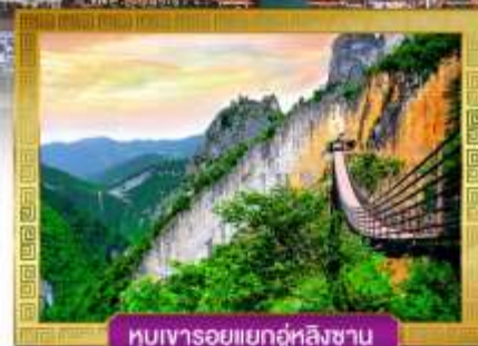
หุบเขารอยแยกอู่หลิงซาน