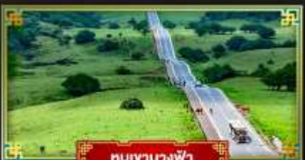
หุบเขานางฟ้า