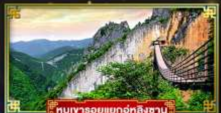
หุบเขารอยแยกอู่ทงซาง