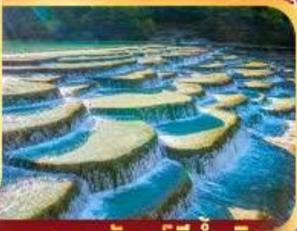
หุบเขาพระจันทร์สีน้ำเงิน