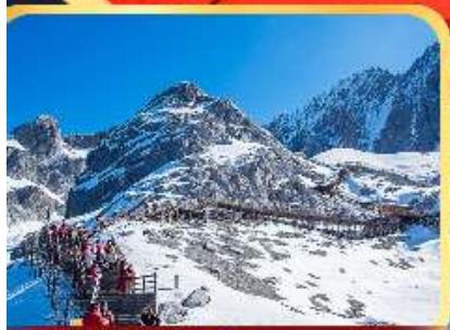
ภูเขาหิมะมังกรหยก