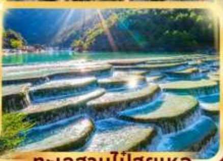
ทะเลสาบไป๋สยเหอ