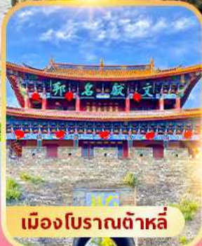
เมืองโบราณต้าลี่