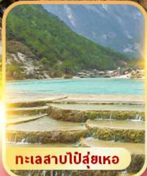
ทะเลสาบปิสุ่ยเหอ