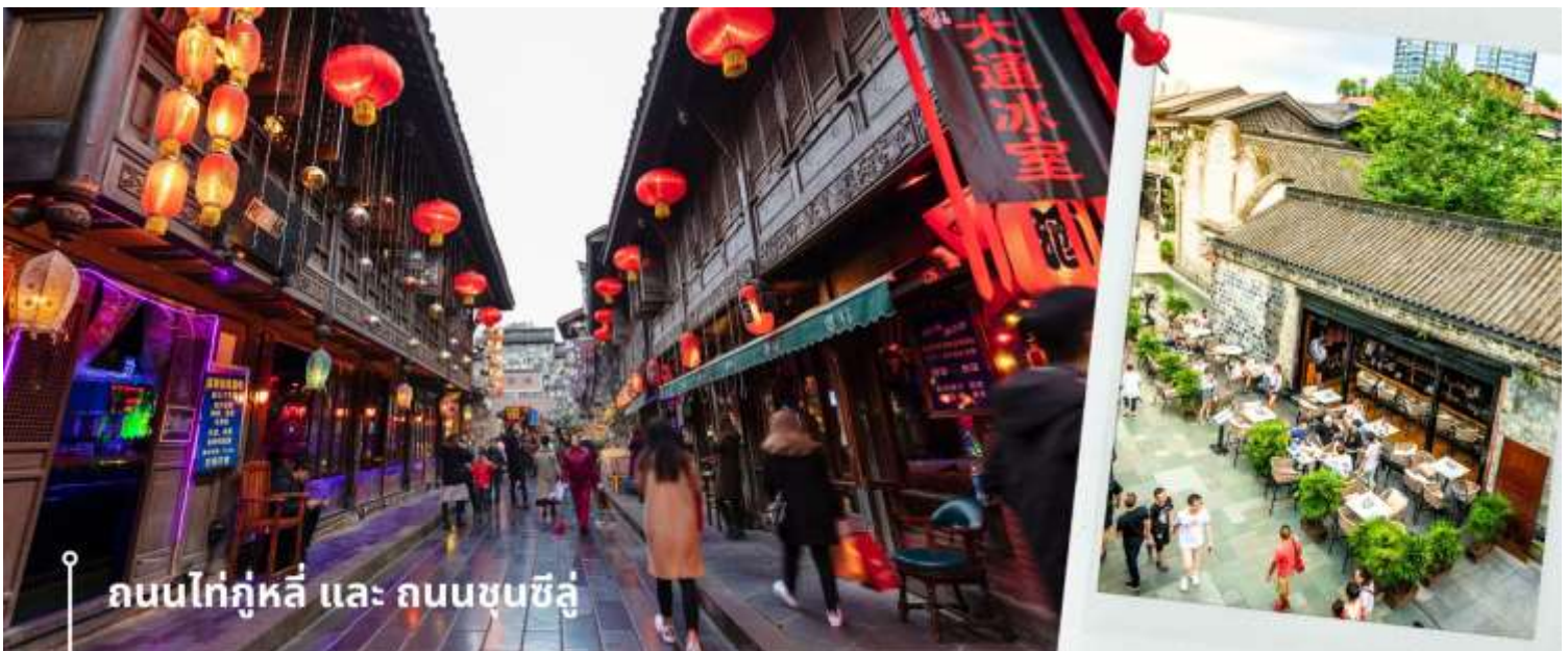
ถนนไท่กู่หลี่ และ ถนนชุนซีลู่

12.45 น. เดินทางถึง สนามบินสุวรรณภูมิ โดยสวัสดิภาพ