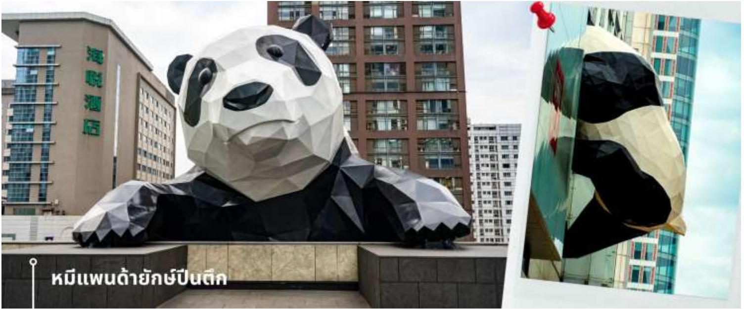
หมีแพนด้ายักษ์ป็นตึก

ป็นตึก และมีส่วนหัวที่โผล่พ้นออกมาจากอาคาร ทำให้เกิดภาพอันน่ารักและน่าประทับใจจากผู้ที่พบเห็นและ