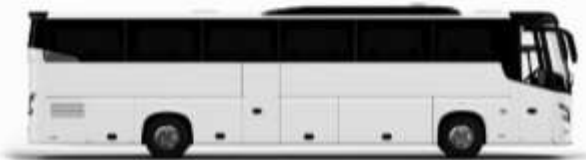
ตัวอย่างรถทัวร์ 1 คัน

ค่าที่พักตามที่ระบุในรายการหรือเทียบเท่าระดับเดียวกัน (พักห้องละ 2 ท่าน) หากประเภทห้องพักท่านริควงมาเป็นอีก เช่น ริควงห้องพักเป็น TWIN BED หรือ DOUBLE BED ทางบริษัทขอสงวนสิทธิ์ในการปรับประเภทห้องพัก เป็นตามที่โรงแรมมีอยู่ โดยไม่ต้องแจ้งให้ทราบล่วงหน้า