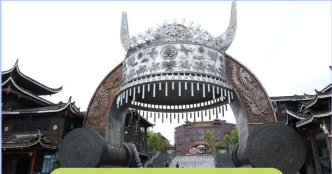
ชมวิถีชีวิตชนเผ่าแม้ว และแสง สี เสียงยามค่ำคืน ณ เมืองซีเจียง