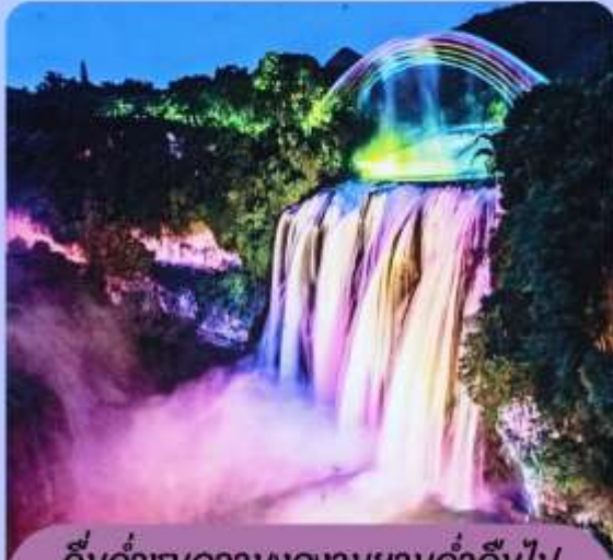
ดื่มด่ำชมความงดงามยามค่ำคืนไป กับ แสง สี เสียงของ น้ำตกเซว่งกั๋วชู่ ยามราตรี