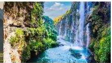
ชุมชนน้ำตกกร้อยสายหม่าหลิงเหอ

*ทางบริษัทฯ ขอสงวนสิทธิ์ในการสลับโปรแกรมทัวร์ตามความเหมาะสมขึ้นอยู่กับสถานการณ์หน้างาน โดยคำนึงถึงผลประโยชน์ของลูกค้าเป็นสำคัญ