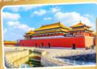
พระราชวังโบราณปักกิ่ง