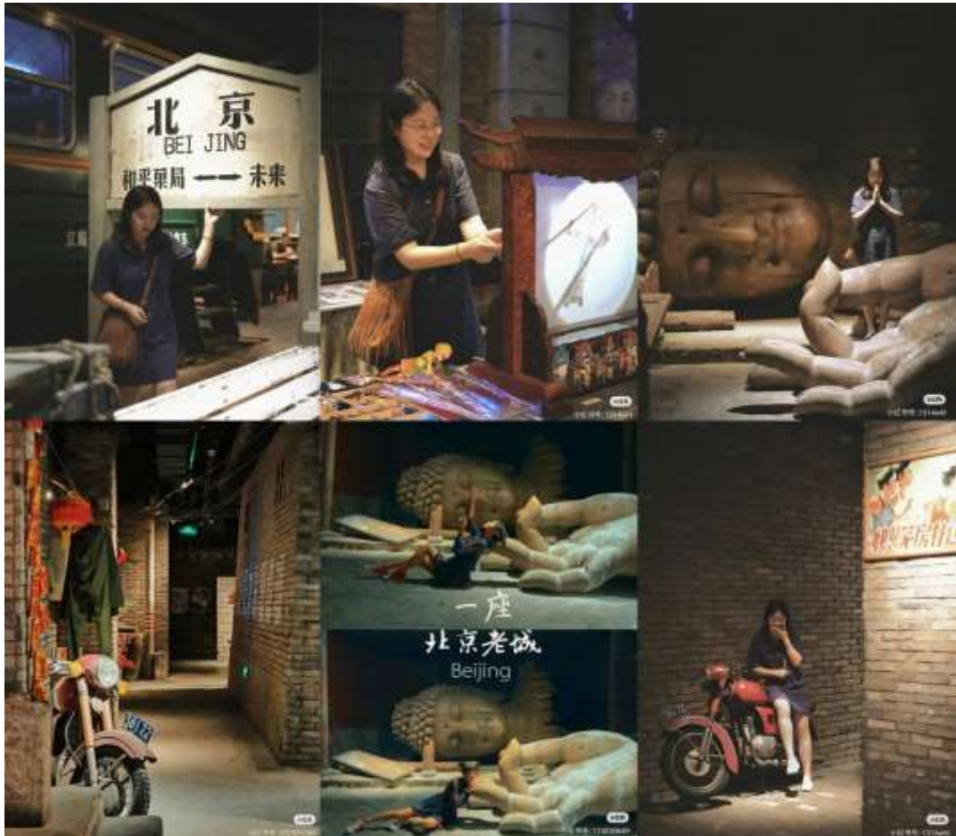
ขอบคุณเจ้าของภาพ (เครดิตตามภาพ)