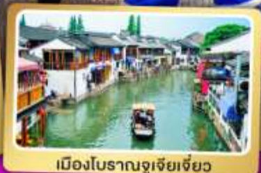
เมืองโบราณจู่เจียเจี้ยว