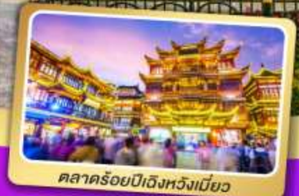
ตลาดร้อยปีเฉิงหวงเมี่ยว