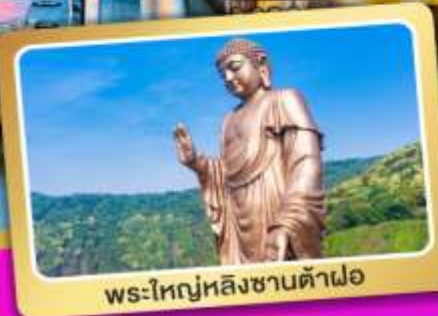
พระใหญ่หลังซานต้าฝอ