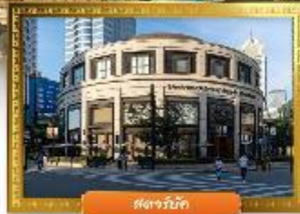
ตงผิงมิก

☑️ ซื้อบิง POP MART ถ่ายรูปคู่กันคิมอีักษ์