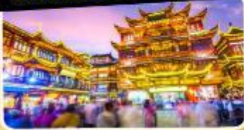
ตลาดร้อยปีเจิ้งหวงเหมียว