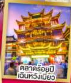
ตลาดร้อยปี เงินหวังเมียว