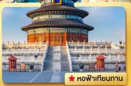
★ หอฟ้าเทียนถาน

เที่ยวเมืองหลวงของประเทศจีน.. ชมประวัติศาสตร์ที่ยิ่งใหญ่ พบกับ..อารยธรรมเก่า.. ความเจริญของยุคปัจจุบัน.. ที่ผสมผสานกันอย่างลงตัว