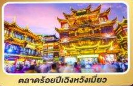
ตลาดร้อยปีเจิ้งหวิงเมี่ยว