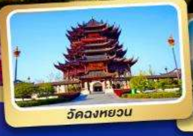
วัดฉงหยวน