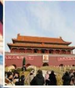
จัตุรัส เทียนอันเหมิน