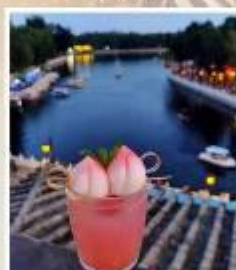
TANG FANG CAFE