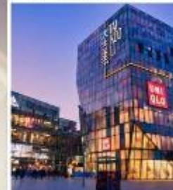
ย่านซานหลี่ถุน