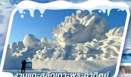
งานแกะสลักเกาะพระอาทิตย์