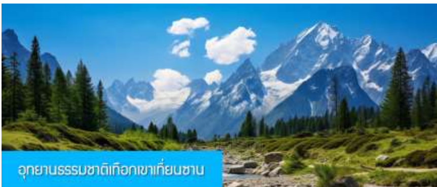
อุทยานธรรมชาติเทือกเขาเทียนชาน

พักที่ HAMPTON BY HILTON URUMQI HOTEL โรงแรมระดับ 4 ดาวหรือเทียบเท่าในเมืองอูรูมฉี