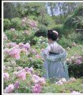
เทศกาลดอกโบตั๋น