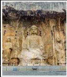
พระพุทธรูปแกะสลัก หิมหลงเหมิน