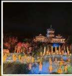
โชว์ SHAOLIN MUSIC CEREMONY