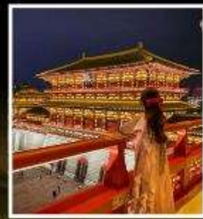
ท่าแพงอึ้งเทียนเหมิน