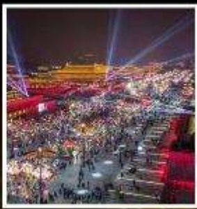
ถนนคนเดินวัฒนธรรมต้าถิง