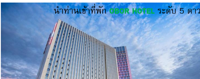
นำท่านเข้าพัก OBOR HOTEL ระดับ 5 ดาว หรือ เทียบเท่า