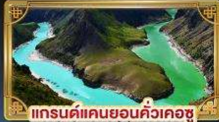
แกรนด์แคนยอนคิ้วเคอซู