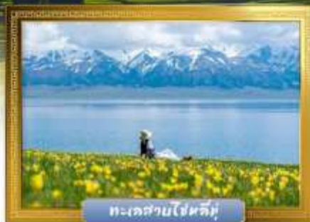
ทะเลสาบไซหลิมู่