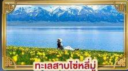
ทะเลสาบไซหลี่มู่