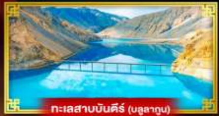
ทะเลสาบบินคิ่ร์ (บลูลาคุน)