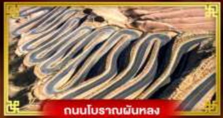
ถนนโบราณผืนหลง

“คัชการ์” เที่ยวสุดขอบตะวันตกประเทศจีน เมืองเก่าแห่งยุคเส้นทางสายไหมโบราณ