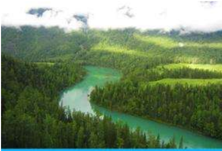
ทะเลสาบเขียวพระจันทร์