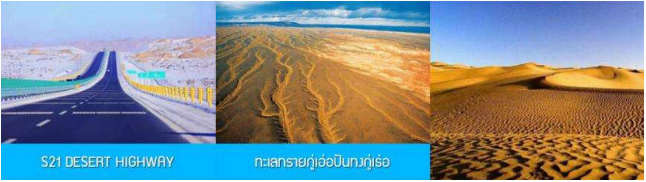
S21 DESERT HIGHWAY