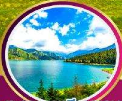
ทะเลสาบเทียนชาน