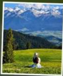
ทุ่งหญ้านาลาจัน