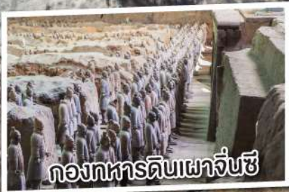
กองทัพดินเผาจิ๋นซี