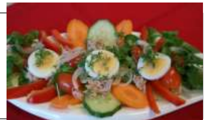
รูปภาพประกอบ

ชมการแสดงการเต้นรำของชนชาติส่วนน้อยหลายชาติพันธุ์