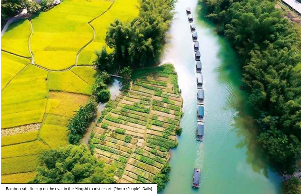
Bamboo rafts line up on the river in the Mingshi tourist resort.

รถบัสนำท่านไปส่งที่ท่าแพต้นน้ำ เพื่อให้ท่าน ลองแพไม้ไผ่หมิงซื่อเกียนเหยียน ชมทัศนียภาพสองฝั่งลำน้ำ และบรรยากาศอันสดชื่นที่มีภูเขาที่เป็นฉากหลัง ที่เรียกว่า "วิวภาพเขียนร้อยลี้" วิวนี้โด่งดังเพราะ มีซีรีส์ทีวี "ฮวาเซียนกุ" มาถ่ายทำที่นี่ ขณะลองแพท่านจะได้พบเห็นวิถีชีวิตของชาวล้วงชนบท ที่ออกมาทำกิจกรรมประจำวัน เมืองจิ่งซีมีอากาศเย็นสบายและมีทัศนียภาพทางธรรมชาติสวยงามคล้ายเมืองกุ้ยหลิน